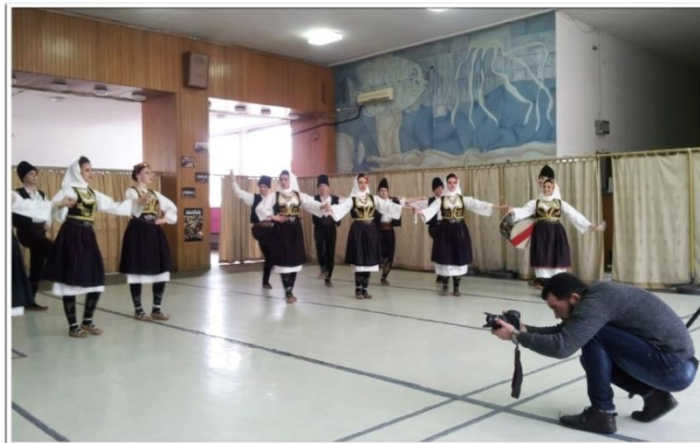
Снимање за емисију ТВ Забавник РТС-а