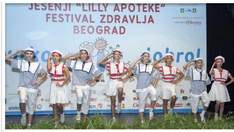
Ученице и ученици Основне балетске школе на Фестивалу здравља