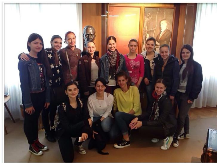
У посети Музеју Иве Андрића