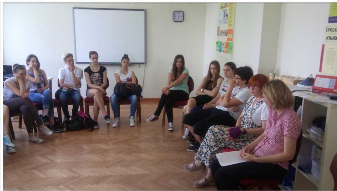
Сусрет са песникињом Радмилом Лазић